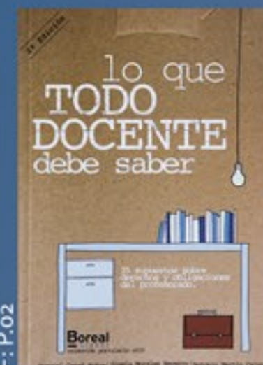
REF: P.02 LO QUE TODO DOCENTE DEBE SABER - Derechos y obligaciones del profesorado