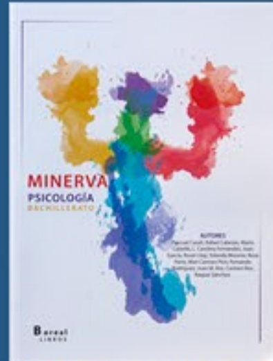
MINERVA - PSICOLOGÍA Bachillerato REF: F.02