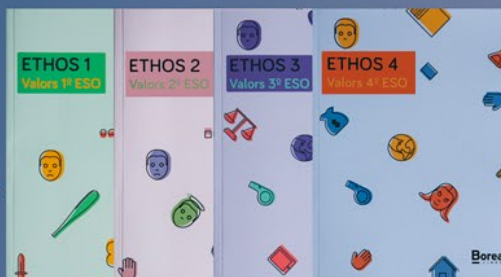
ETHOS - Valores éticos para E.S.O. VALENCIA