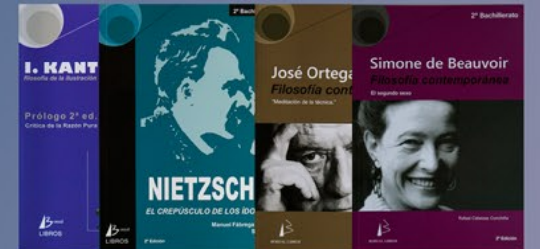
PLATÓN, ARISTÓTELES, TOMÁS DE AQUINO, DESCARTES KANT, NIETZSCHE, ORTEGA Y GASSET, SIMONE DE BEAUVOIR REFS: H.01-H.04 // REFS: H.05-H.08