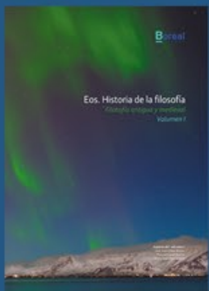
EOS Hist. de la filosofía Bachillerato (Vol I, II y III) REF: F03