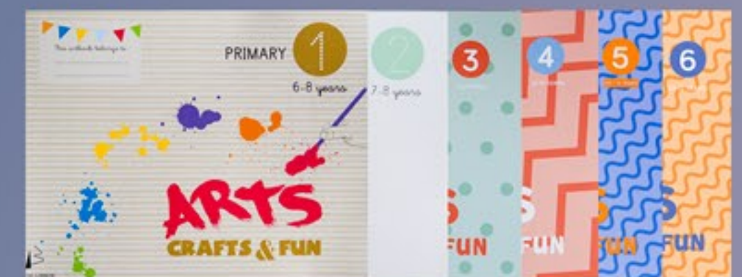
ARTS, CRAFTS & FUN Plástica en inglés para Educación Primaria Niveles 1 a 6 - REF: ARTS

Puede consultar y descargar nuestro catálogo íntegro en nuestra web www.boreallibros.es Teléfono - 603 786 724 Mail - boreal@boreallibros.es