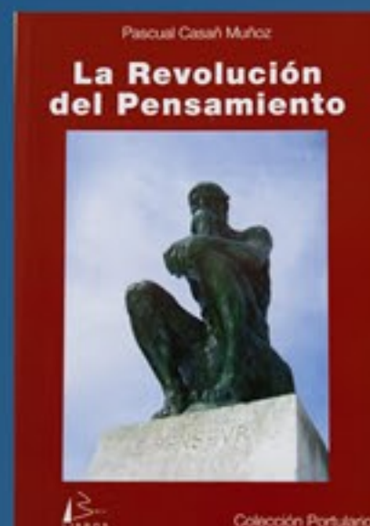
LA REVOLUCIÓN DEL PENSAMIENTO REF: F04