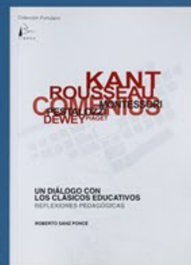
REF: P.01 UN DIÁLOGO CON LOS CLÁSICOS EDUCATIVOS Reflexiones pedagógicas