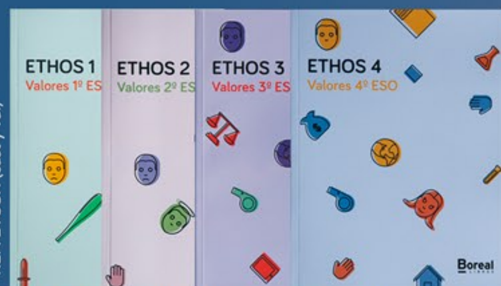
REF: ETOSH (cast y val)