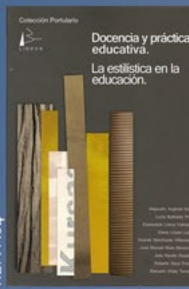
REF: P.04 DOCENCIA Y PRÁCTICA EDUCATIVA La estilística en la educación